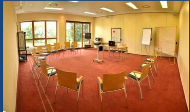
Seminarraum II „Azalee“ ca. 64 m 2