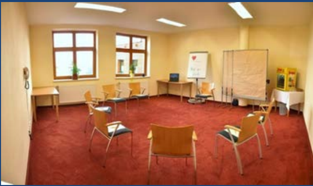
Seminarraum III „Glücksgroschen“ ca. 36 m 2