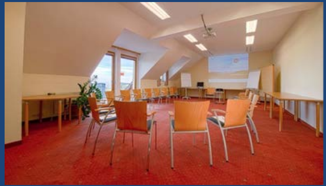
Seminarraum IV „Adler“ ca. 67 m 2