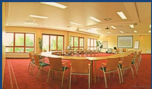
Seminarraum I+II ca. 140 m 2

...und viele weitere gemütliche Nischen für kreative Gruppenarbeiten.