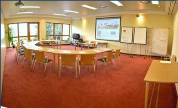
Seminarraum I „Glücksmuschel“ ca. 72 m 2