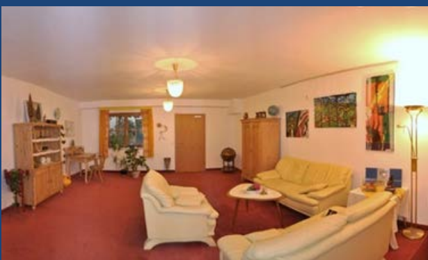
für Gruppenarbeiten die „Bibliothek“ ca 30 m 2